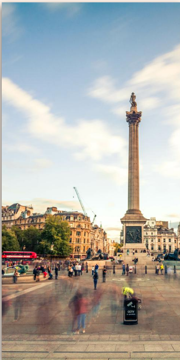
Nelson's Column, Trafalgar Square, London

Najlepszym sposobem uczenia się i zapamiętywania jest powtarzanie na głos oraz zapisywanie, dlatego też proponujemy, żeby wraz z coraz dalszym przechodzeniem tego kursu zaopatrzyć się w kartę i długopis, lub program tekstowy na komputerze taki jak Pages, Word, czy po prostu notatnik. W każdym workbooku znajdziesz trzy główne części: